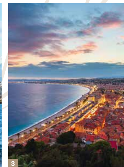
3- Nice et la Promenade des Anglais à 15 min' en voiture

Bordée par les eaux scintillantes de la Méditerranée et les reliefs majestueux des Préalpes, la Côte d'Azur cultive un art de vivre rare et intemporel. Entre stations balnéaires emblématiques et villages perchés au charme préservé, elle dévoile un décor où l'élégance se mêle à l'authenticité.