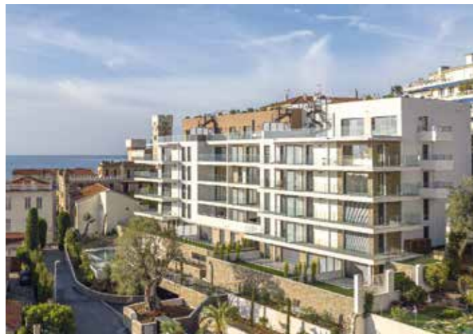
BAIE HORIZON - NICE