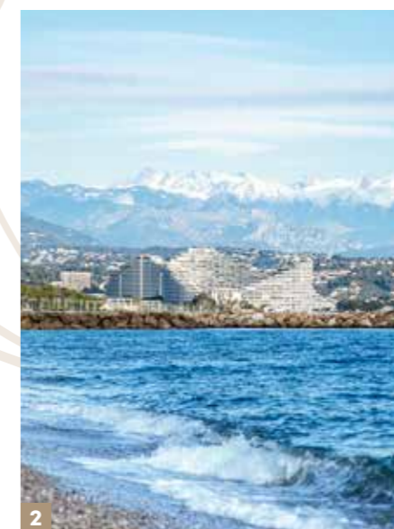
2 - Les stations de ski du Mercantour à 2 h' en voiture