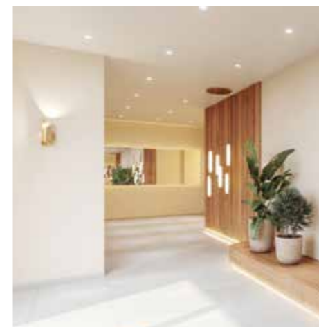
Illustration non contractuelle à caractère d'ambiance d'une opération SAGEC

Ce même esprit se prolonge dans les paliers d'étage, où chaque détail renforce cette sensation d'harmonie. À mesure que vous avancez vers votre porte, l'ambiance feutrée et élégante vous invite à savourer pleinement l'art de vivre Onde Marine.