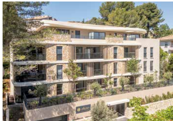
ELLIPSE - MOUGINS