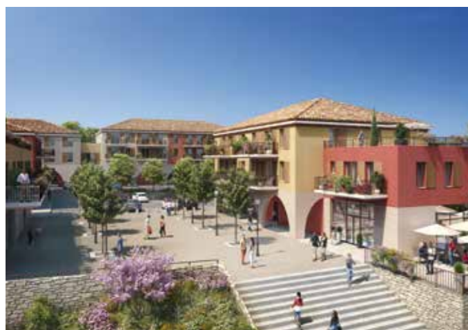
CŒUR ST-GEORGES - LA ROQUETTE-SUR-SIAGNE