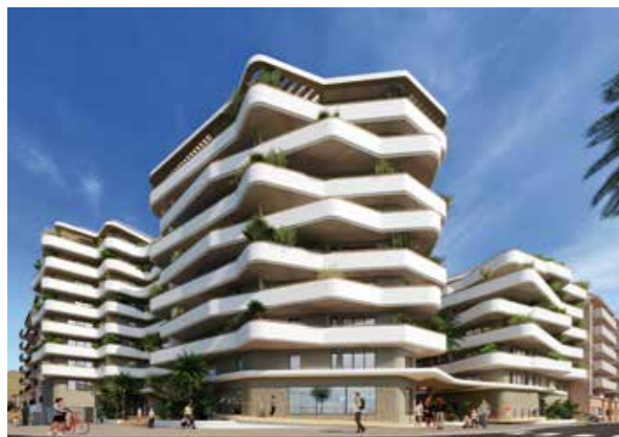
ICÔNE - CANNES-LA-BOCCA