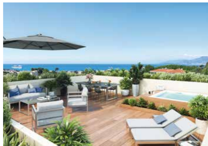
PARC BEL AZUR - ANTIBES