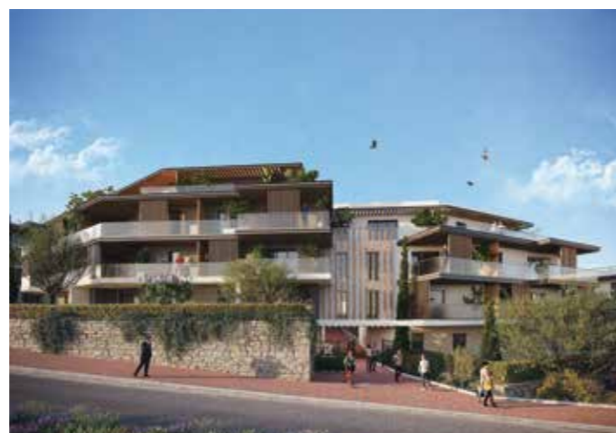
RIVA PARC - LA GAUDE