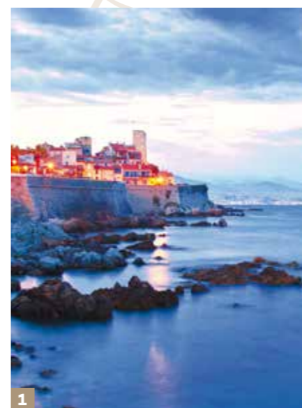
1 - Le vieil Antibes à 10 min' en voiture