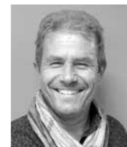
Jean-Philippe Cabane ABC ARCHITECTES

L'usage de matériaux traditionnels tels la pierre, le bois, le verre et l'enduit affirme le caractère méditerranéen de cette petite résidence de standing qu'ambitionne de devenir prochainement «Onde Marine» avec ses douces lignes courbes et épurées. »