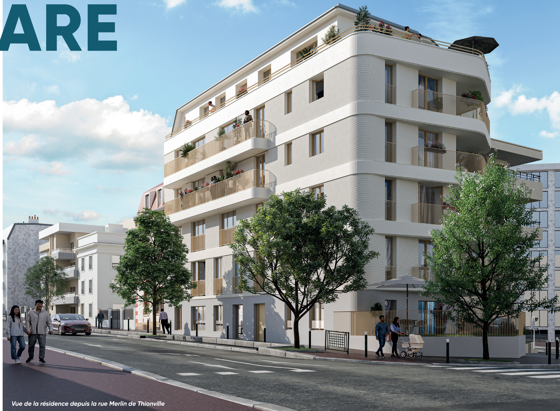
Vue de la résidence depuis la rue Merlin de Thionville