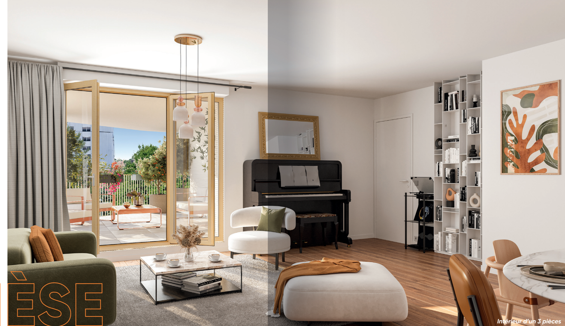
Intérieur d'un 3 pièces

Autant d'espaces conçus comme une respiration, pour profiter de chaque moment, chez soi, en toute simplicité. pas à ses murs, la plupart bénéficient d'un prolongement vers l'extérieur : loggia à l'abri des regards, balcon ouverts, terrasse baignée de soleil et jardin en rez-de-chaussée.