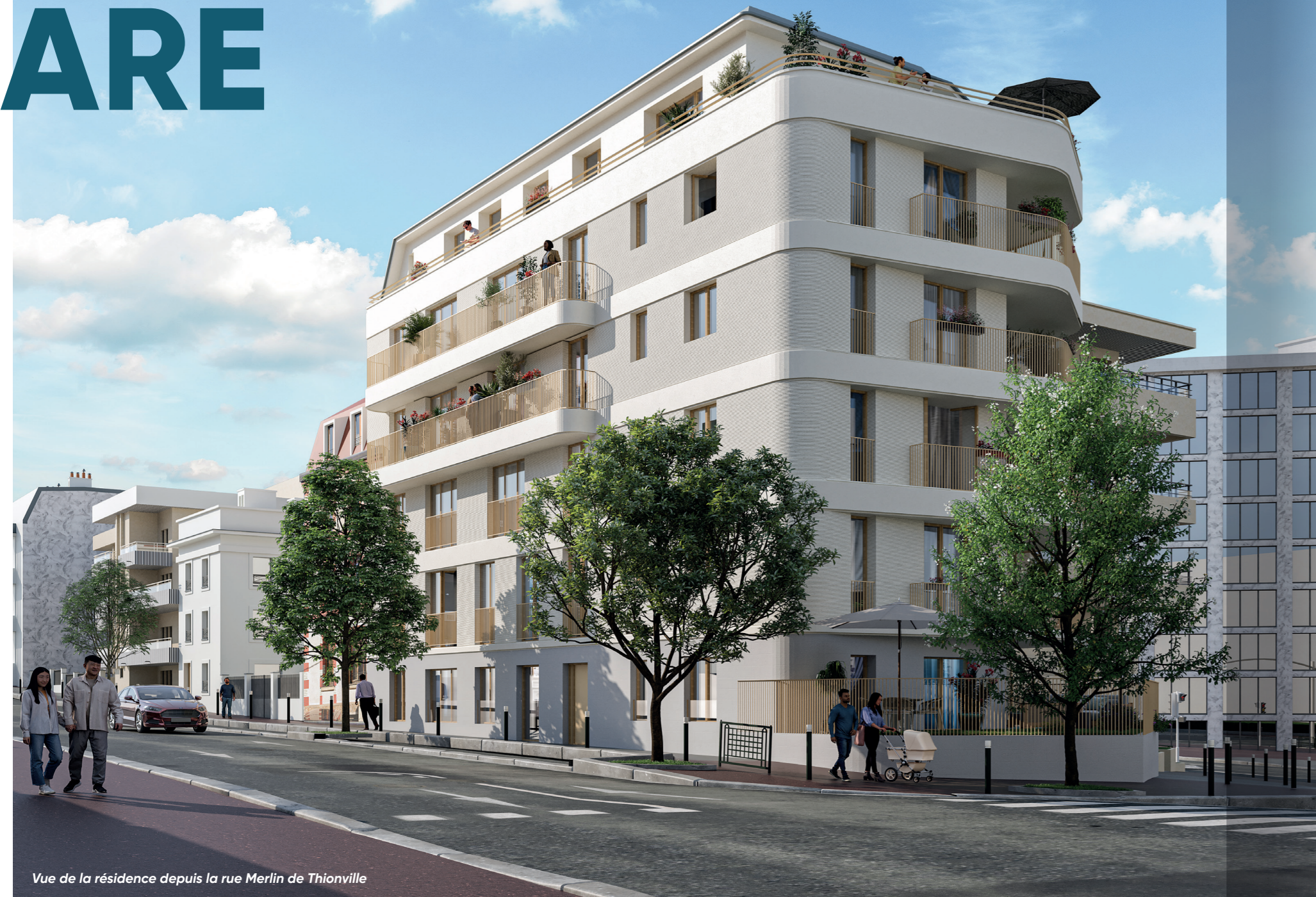
Vue de la résidence depuis la rue Merlin de Thionville