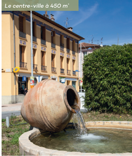
Le centre-ville à 450 m*