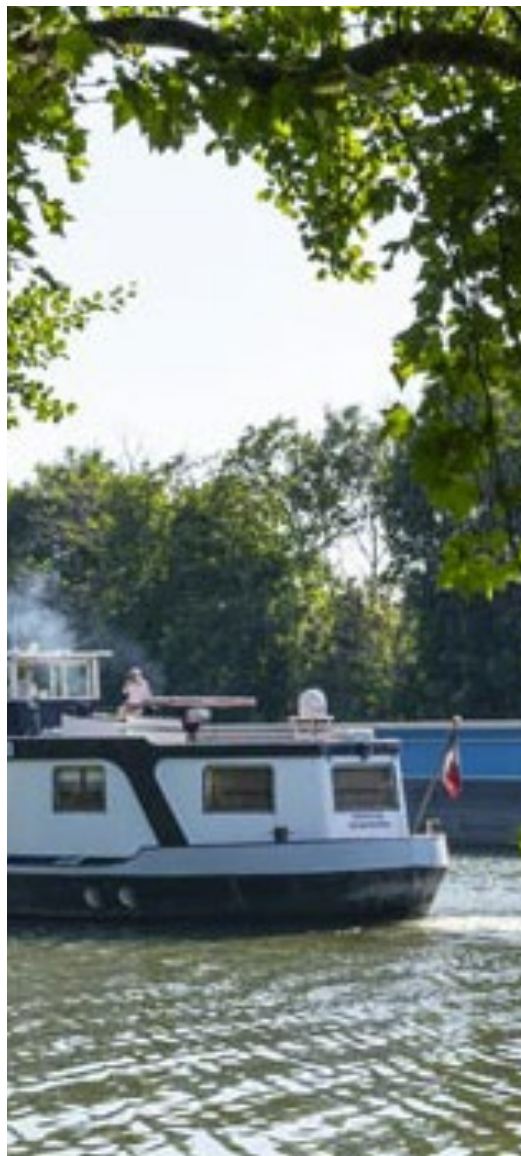
Bord de Seine