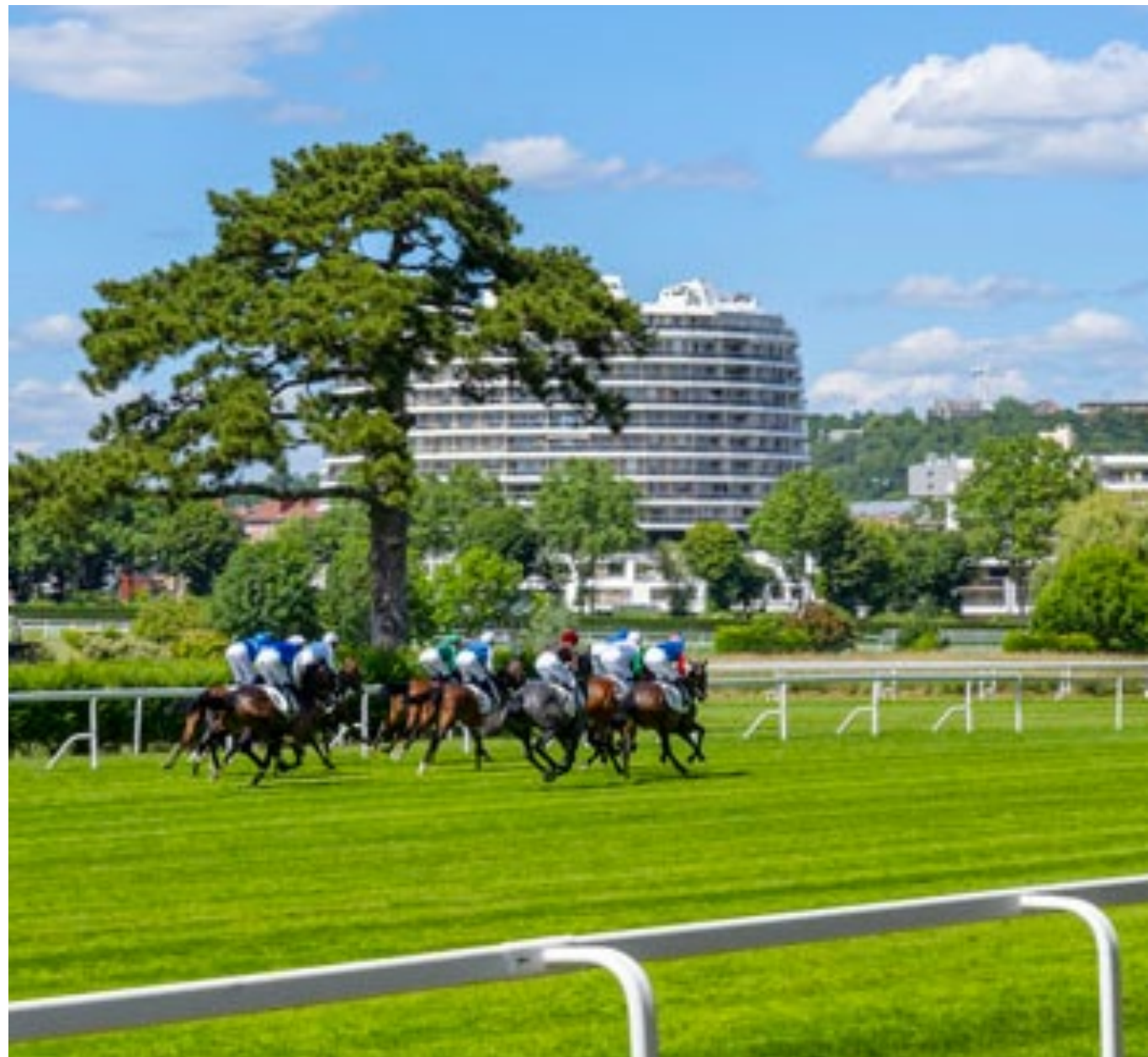
Hippodrome de Saint-Cloud