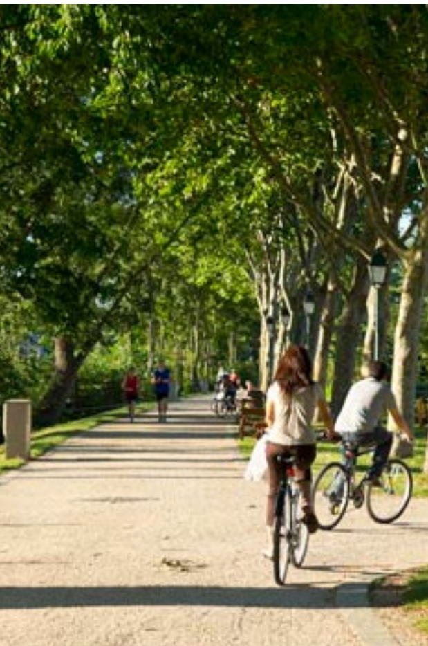
Quai de Halage