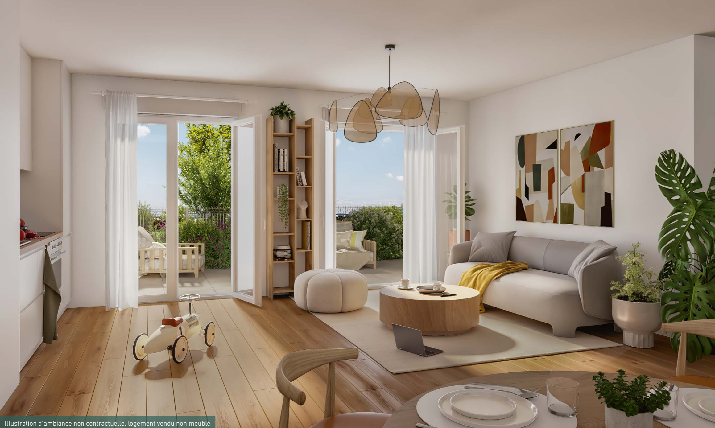
Illustration d'ambiance non contractuelle, logement vendu non meublé