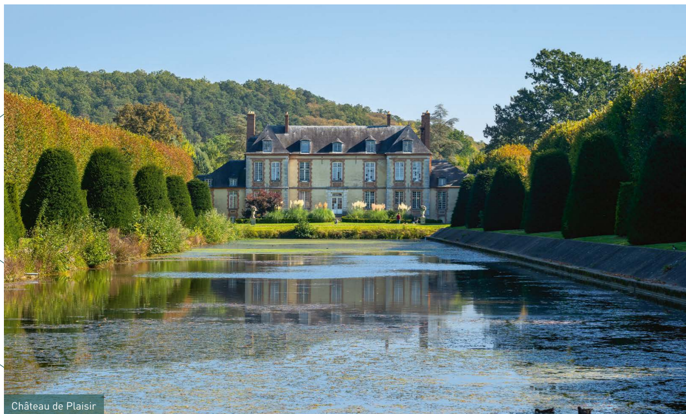
Château de Plaisir