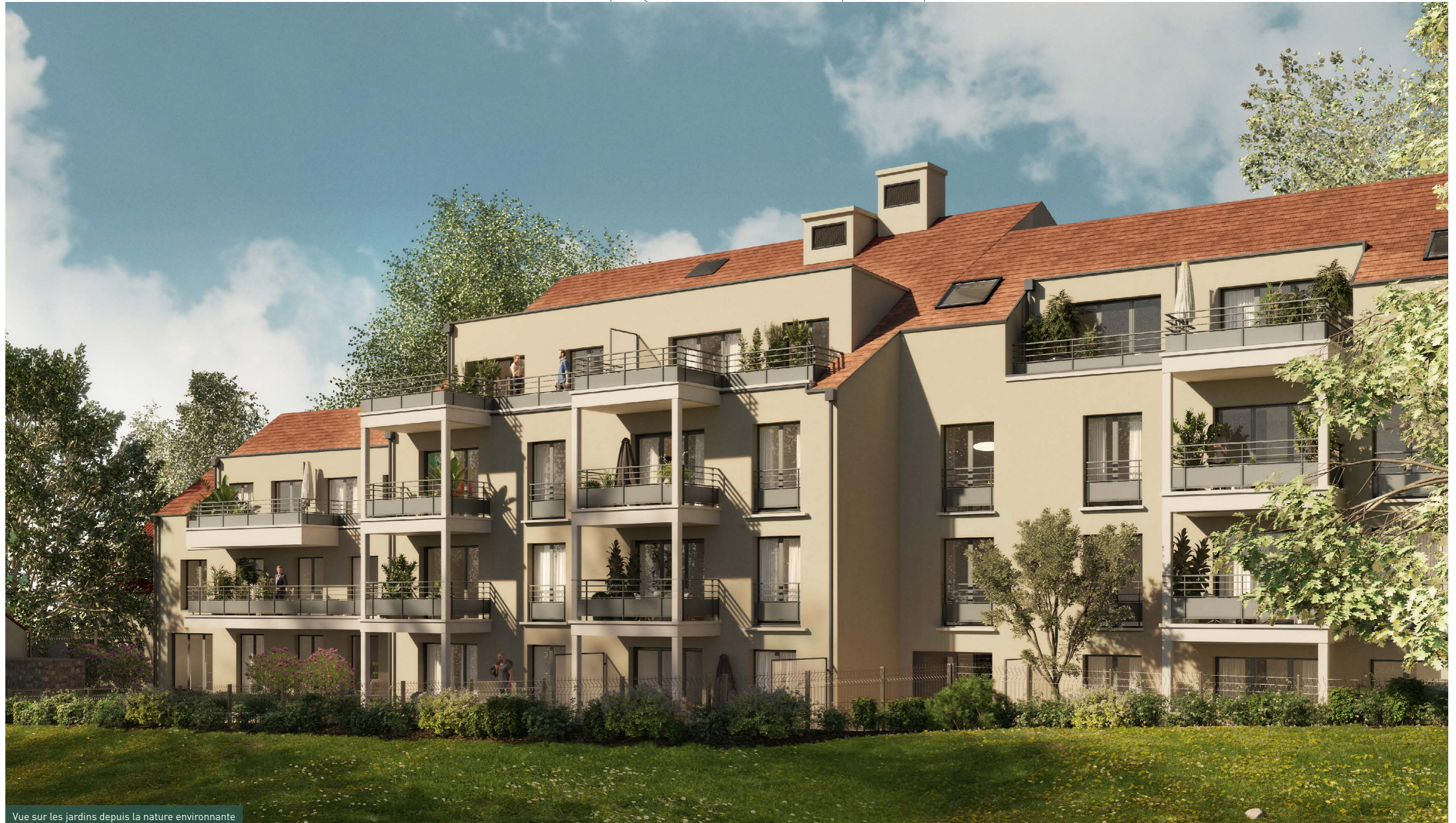
Vue sur les jardins depuis la nature environnante

Et pour compléter ce tableau bucolique tout en préservant l'intimité des habitants, les clôtures sont doublées de haies végétales composées d'érables champêtres.