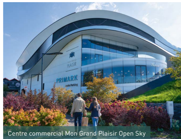
Centre commercial Mon Grand Plaisir Open Sky

Bordée par la forêt de Sainte-Apolline et le bois de la Cranne, Plaisir porte bien son nom. Entre une nature préservée et une situation géographique stratégique à 30 km* de Paris, au cœur des bassins d'emplois de la Communauté d'Agglomération de Saint-Quentin-en-Yvelines, la ville offre à ses habitants douceur de vivre et dynamisme.