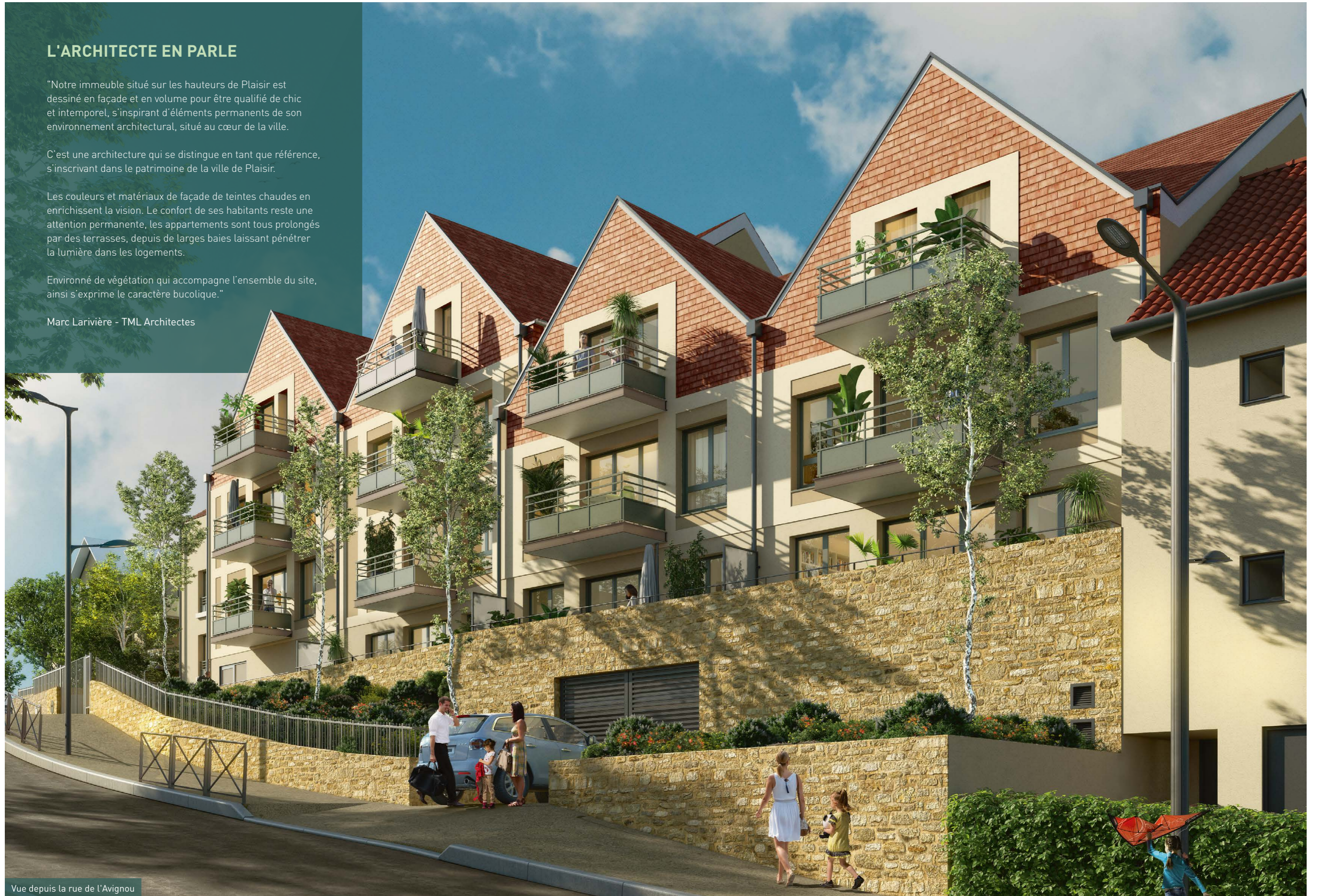
Vue depuis la rue de l'Avignou