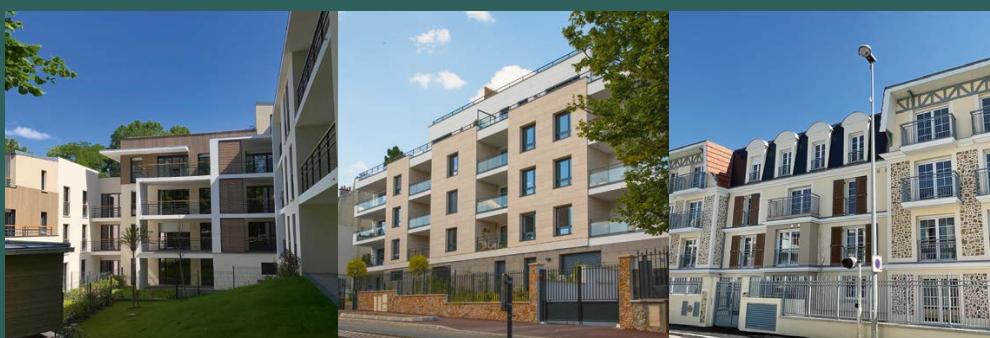
La Celle-Saint-Cloud / 78