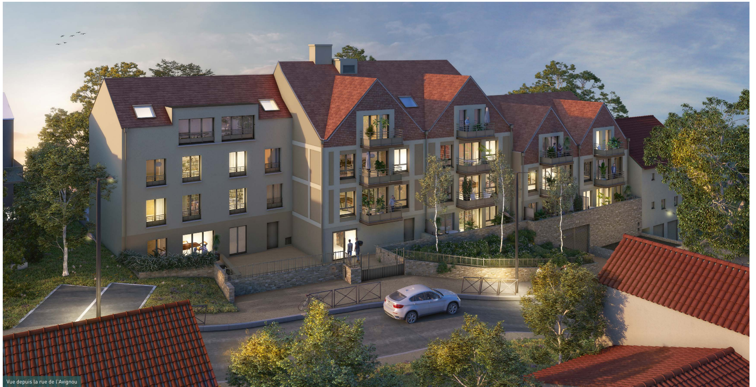
Vue depuis la rue de l'Avignou