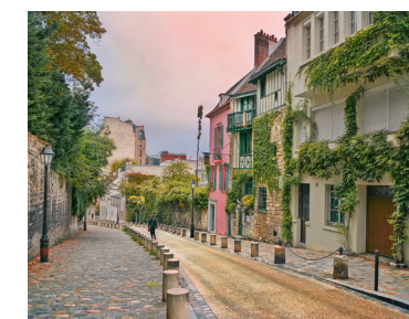
Rue de l'Abreuvoir

Vivre ici, c'est s'offrir un quotidien empreint de poésie et d'inspiration, une parenthèse intemporelle au cœur de l'effervescence parisienne.