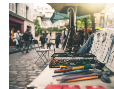
Place du Tertre