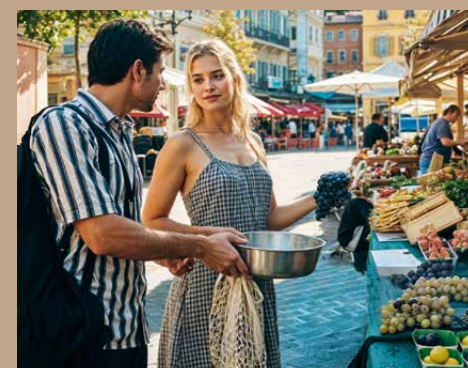
Marché - Libération