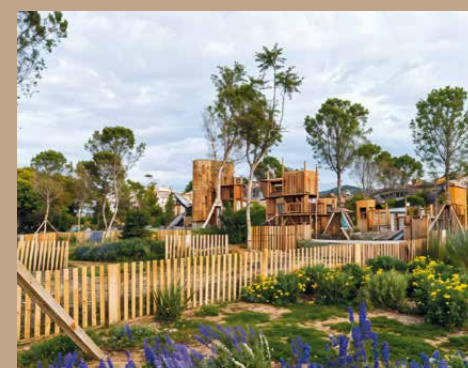
Parc du Ray - 3 hectares verts au cœur de la Ville