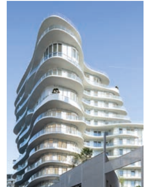
Unic - PARIS | 17