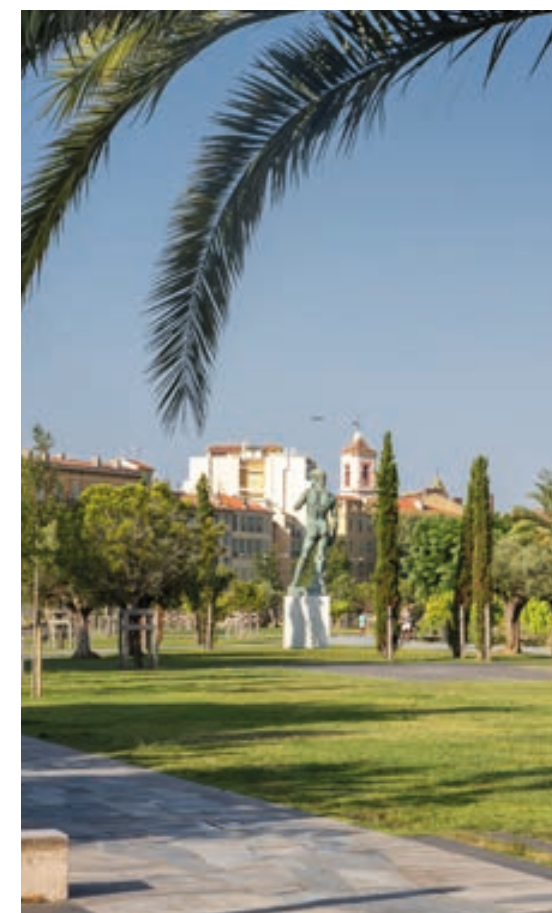
La Promenade du Paillon