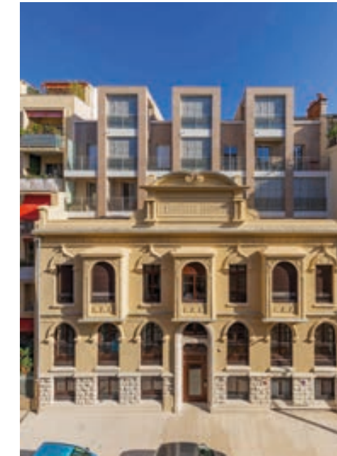
28 Berlioz - NICE | 06

Emerige, société par actions simplifiée au capital de 3 457 200 €, immatriculée au RCS de Paris sous le numéro 350 439 543 - Siège social : 121 avenue de Malakoff 75116 Paris. Architecte : Architectes Côte d'Azur - Perspectivistes : Mysis - Illustrations non contractuelles à caractère d'ambiance. Document et informations non contractuels. Réalisation : communeimage.net - 06/2025