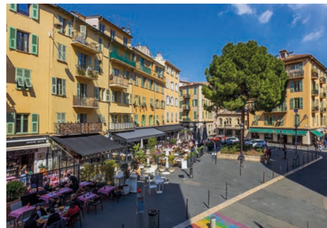
La place du Pin