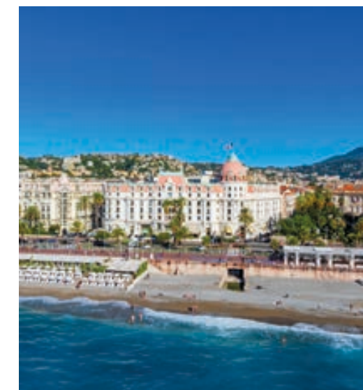
La Promenade des Anglais