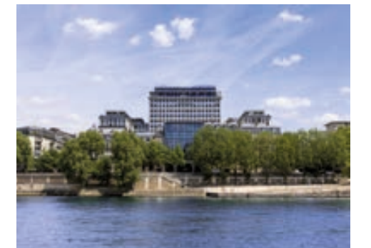
Morland Mixité Capitale - PARIS | 4