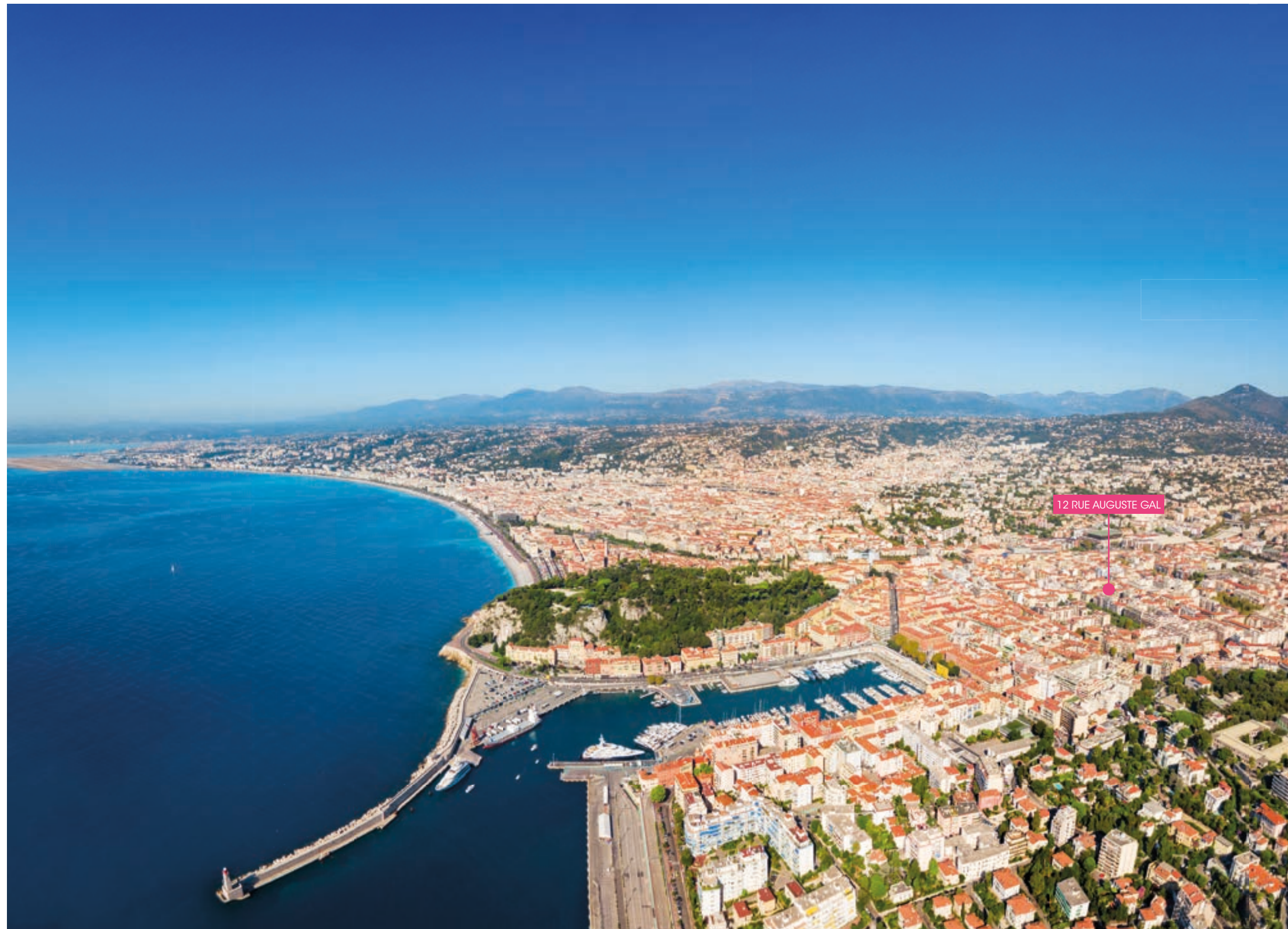
La Baie des Anges