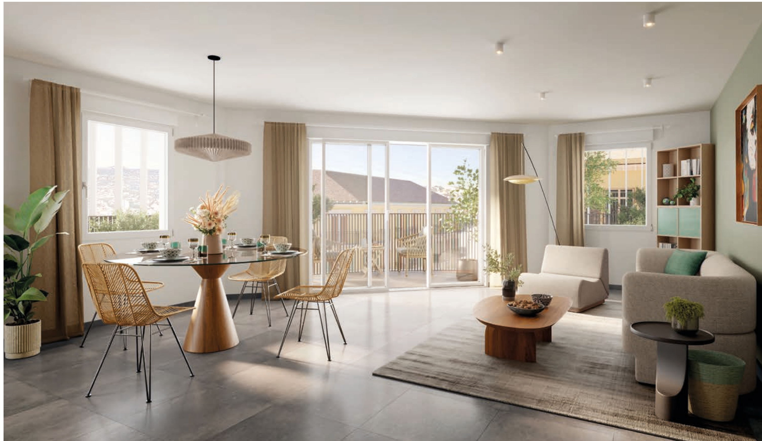
Vue du séjour d'un appartement 4 pièces