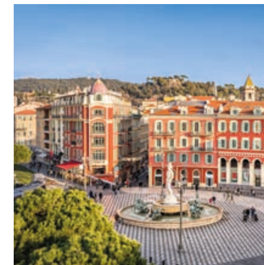
La place Masséna