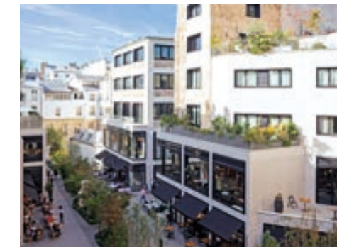
Beupassage - PARIS | 7