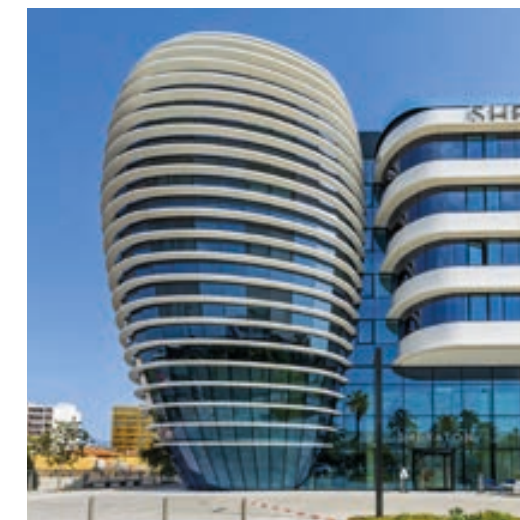
Le Centre d'affaires Arénas