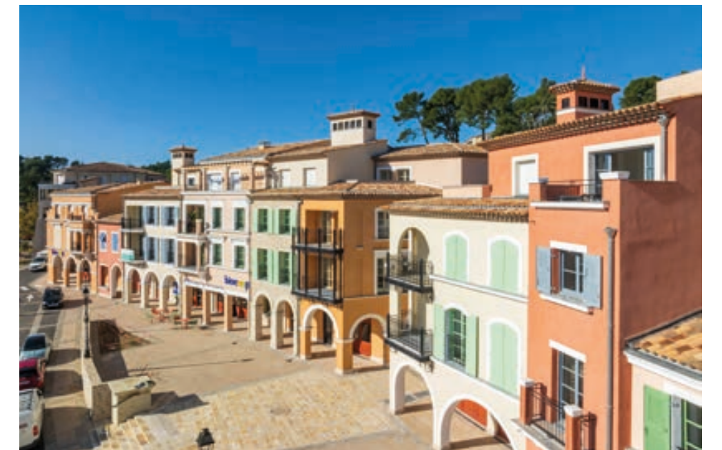
Chemin des Comtes de Provence - LE ROURET | 06