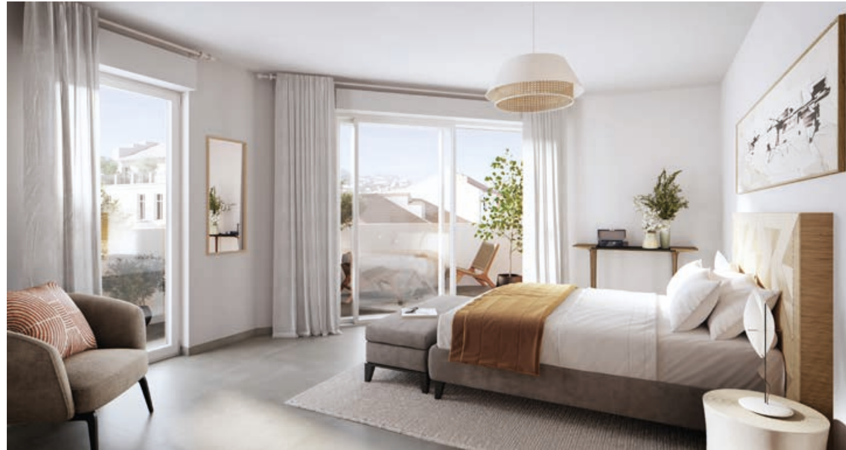
Vue de la chambre d'un appartement 4 pièces