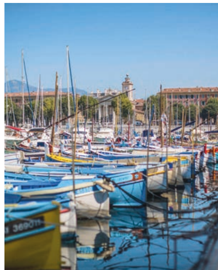
Le Port de Nice

Le soir venu, tram' et bus nous ramènent rapidement vers les théâtres, les musées ou l'aéroport international. Dans ce quartier authentique et vivant, chaque instant compose une expérience douce et spontanée, à la mesure d'une adresse précieuse en cœur de ville.