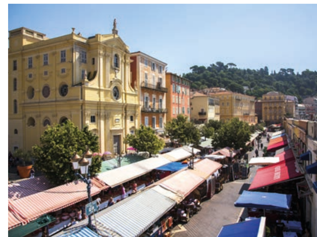
Le Vieux Nice et son cours Saleya