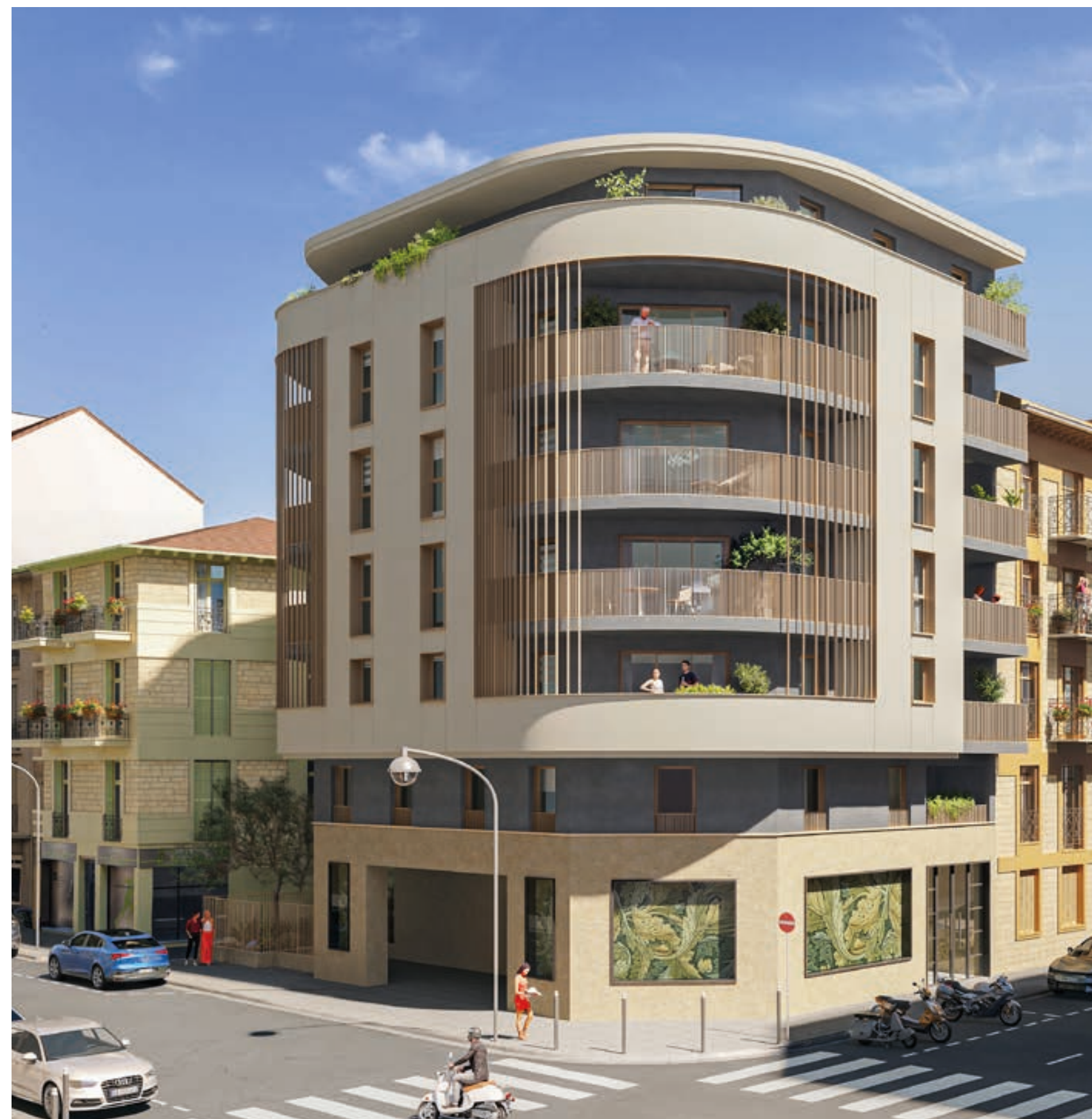
Vue de la résidence depuis l'angle de la rue Smolett et Auguste Gal

Bâtitteur d'une ville plus belle pour tous, Emerige contribue également à l'essor de l'art dans la ville, à travers l'acquisition ou la commande systématique d'œuvres d'art contemporain dans le cadre de la charte « 1 immeuble, 1 œuvre » qu'il a co-fondée en 2015 sous l'égide du ministère de la Culture. Près de 100 œuvres ont été commandées à des artistes et installées dans ses immeubles résidentiels et tertiaires.