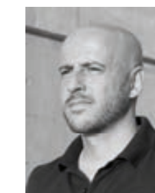
Olivier Zahra Architectes Côte d'Azur

Comme une résidence qui raconte l'histoire du site, dessinée pour la ville et l'habitat moderne. ”