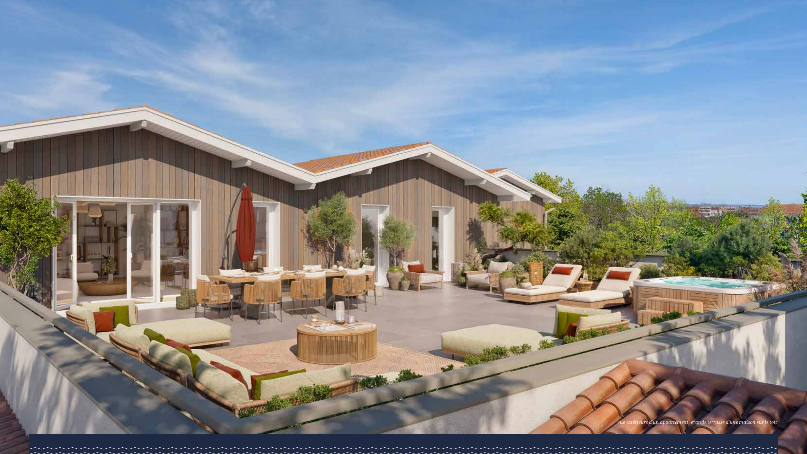
Vue extérieure d'un appartement, grande terrasse d'une maison sur le toit