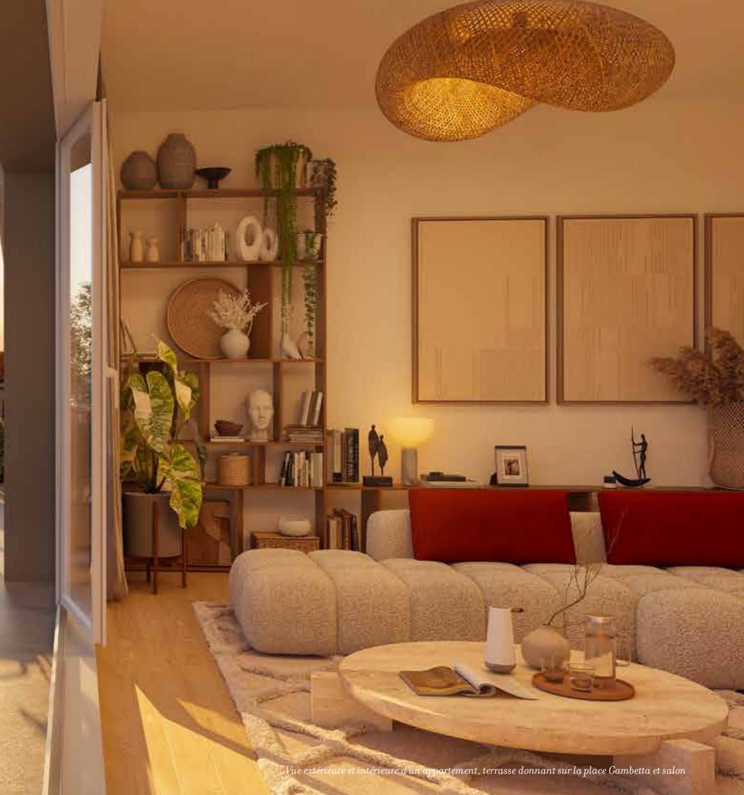
Vue extérieure et intérieure d'un appartement, terrasse donnant sur la place Gambetta et salon