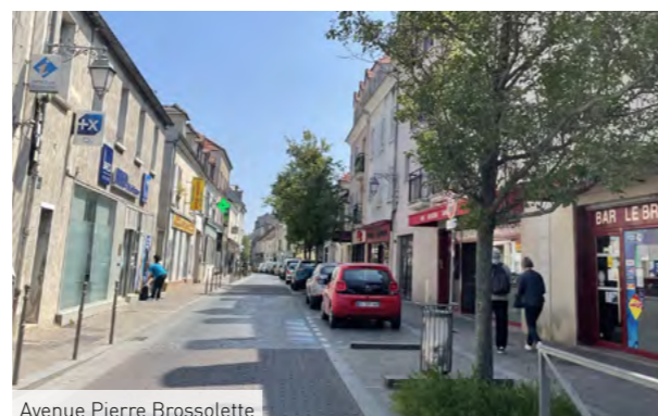
Avenue Pierre Brossolette