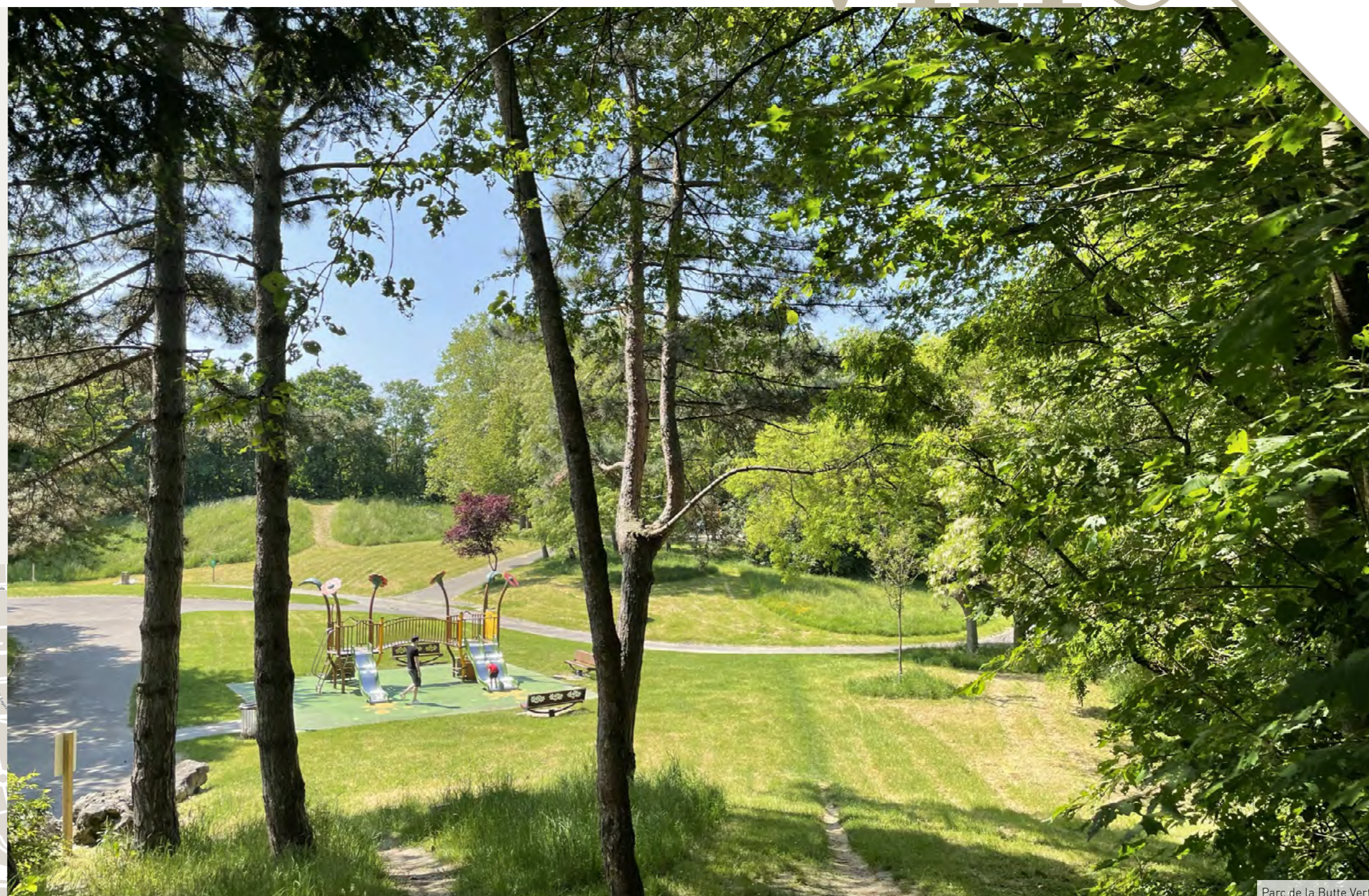
Parc de la Butte Verte