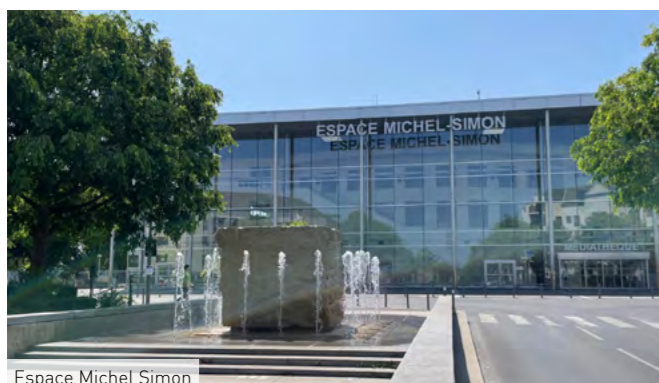
Espace Michel Simon