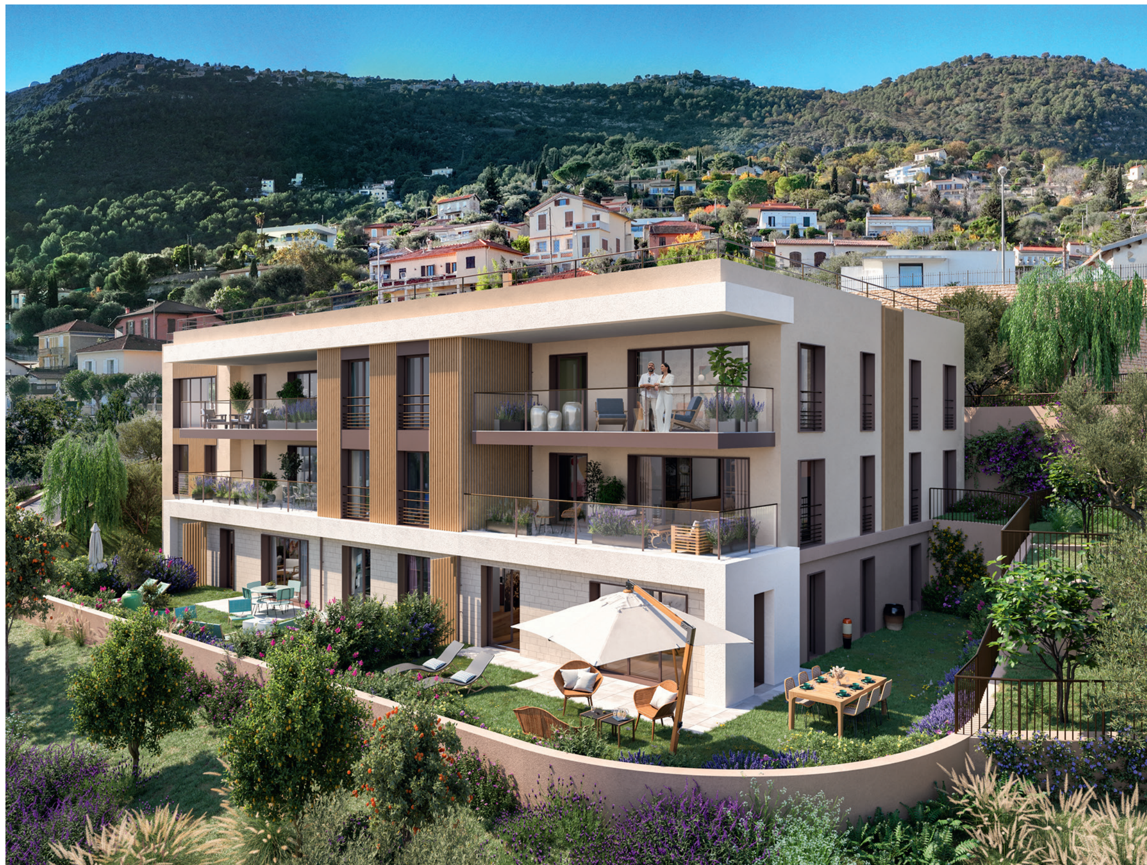
Immagine dell'edificio dal giardino paesaggistico