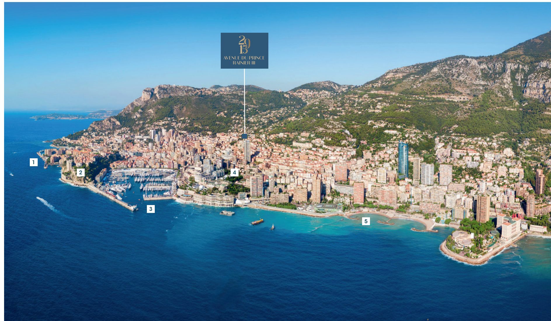
1 Porto e quartiere degli affari di Fontvieille | 2 La Rocca e il Palazzo del Principe | 3 Porto Hercules | 4 La piazza del Casino e l'Opéra Garnier | 5 La spiaggia del Larvotto