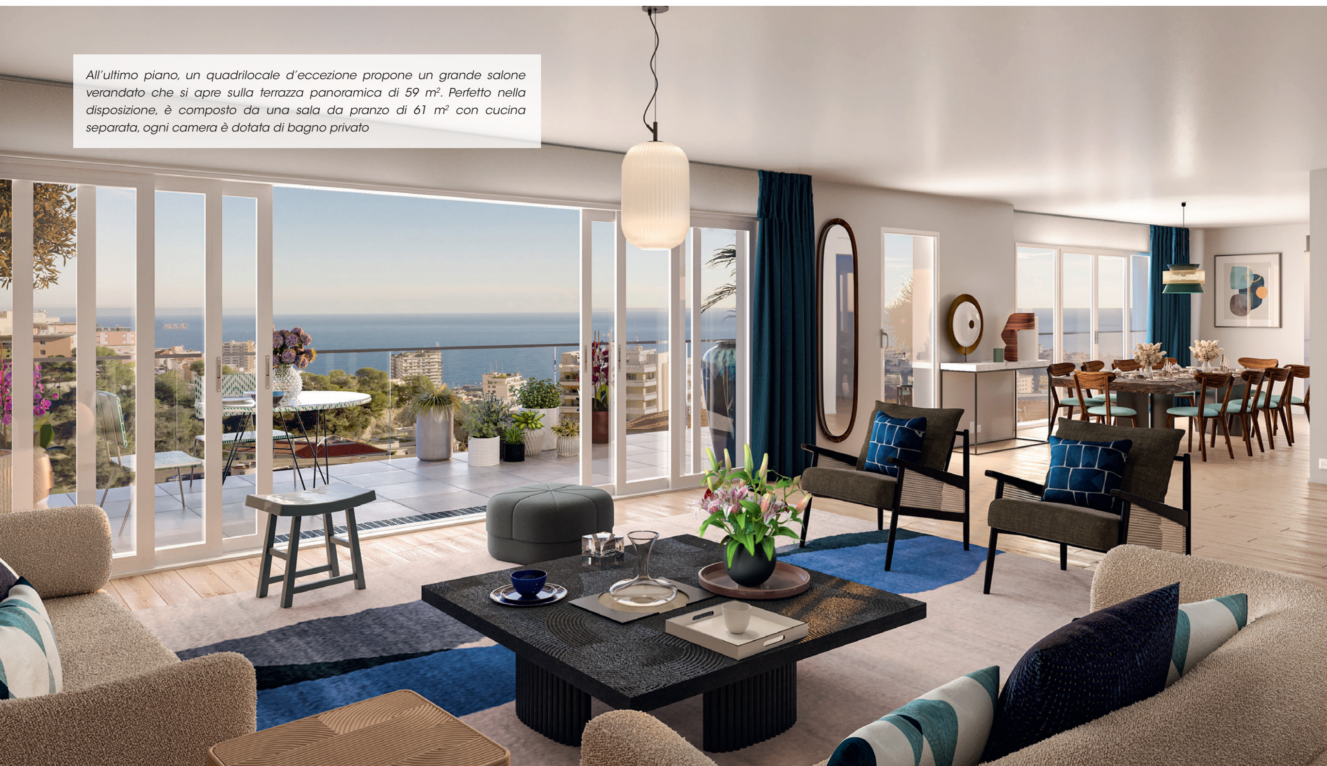
Immagine del soggiorno del pentalocale

All'ultimo piano, un quadrilocale d'eccezione propone un grande salone verandato che si apre sulla terrazza panoramica di 59 m 2 . Perfetto nella disposizione, è composto da una sala da pranzo di 61 m 2 con cucina separata, ogni camera è dotata di bagno privato