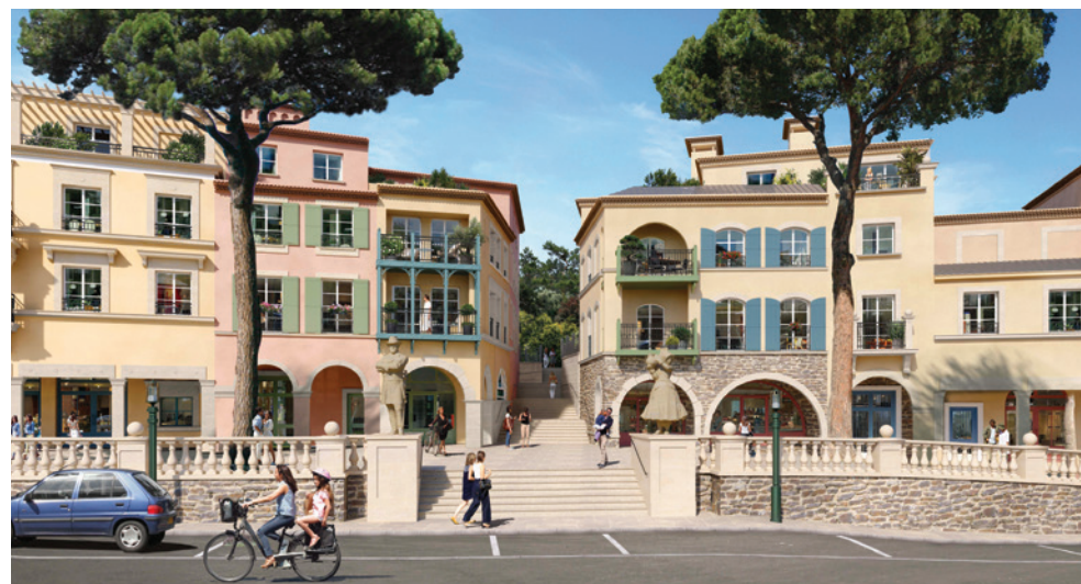
Chemin des Comtes de Provence - LE ROURET | 06