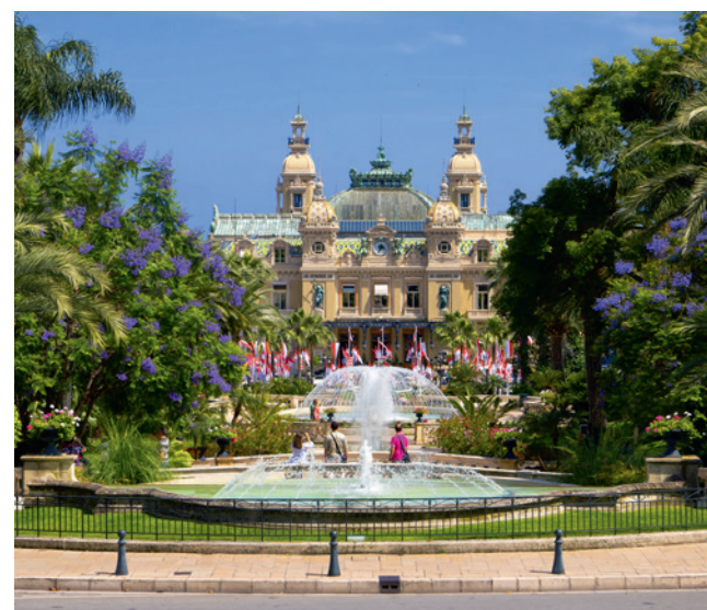
La Piazza del Casino di Monaco