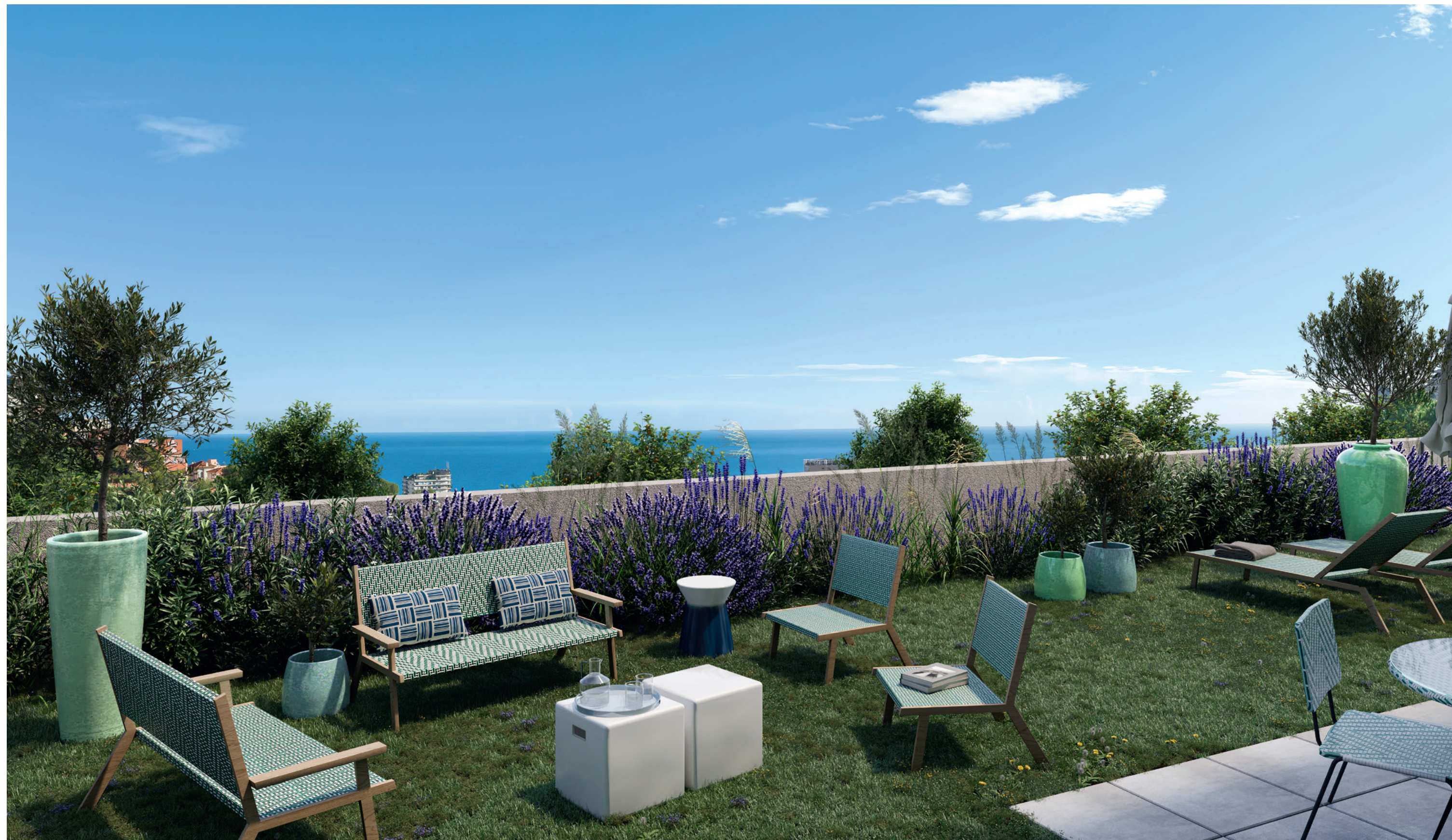
Immagine di un giardino a pianterreno