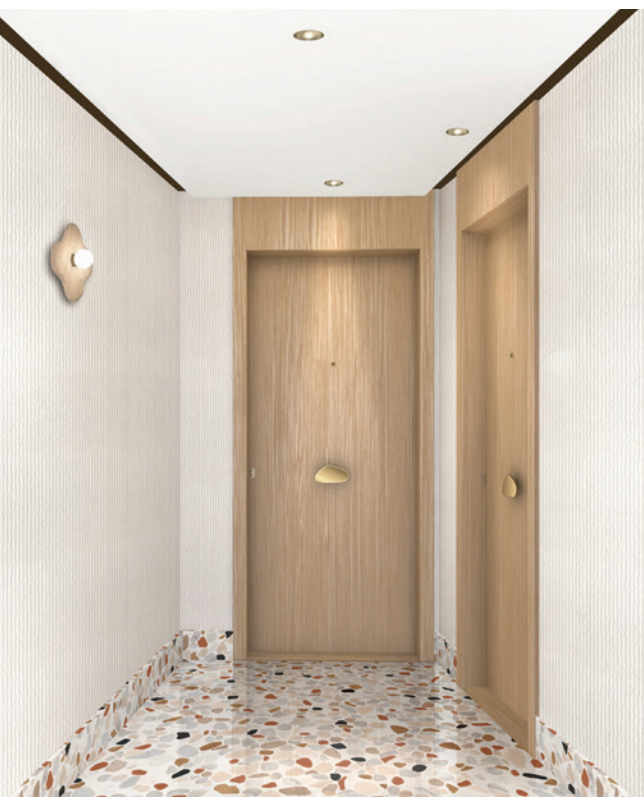
Immagine di un pianerottolo