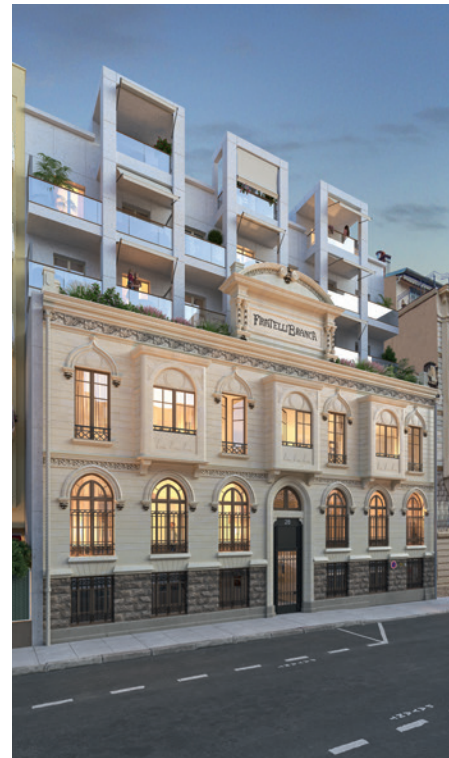
28 Berlioz - NICE | 06