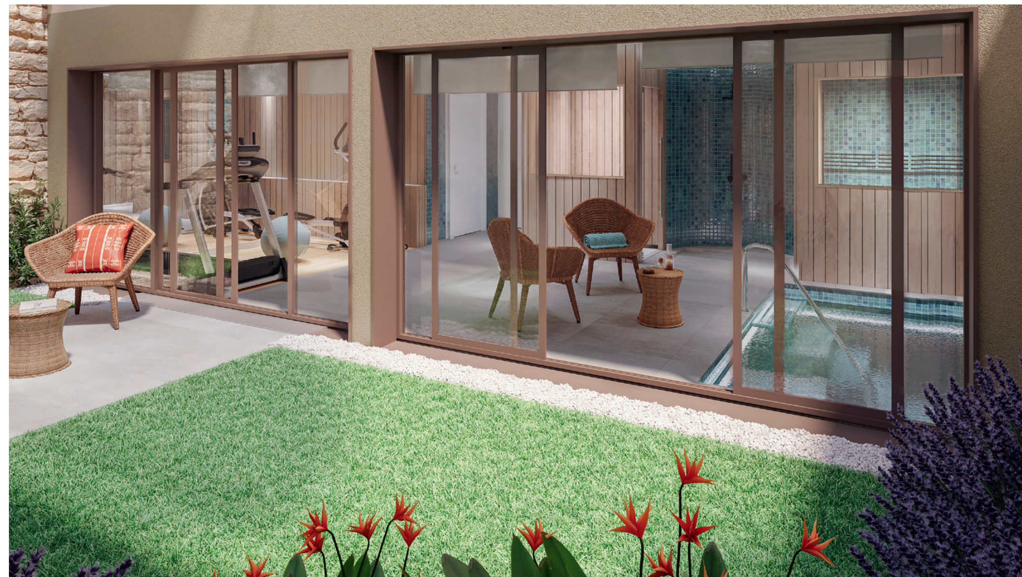
Immagine dello spazio benessere comune a pianterreno

Per offrire il massimo comfort, l'immobile dispone di uno spazio benessere riservato ai condomini, con servizi degni di un resort: spa, sauna, hammam e attrezzature per il fitness. Lo spazio, tutto vetrato, si affaccia su un giardinetto attiguo con piante verdi e da fiore, dove prolungare i momenti di sport o di relax.