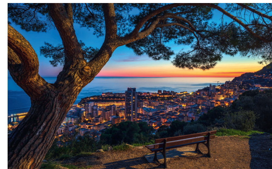
Il Parc Grima sovrastante l'immobile