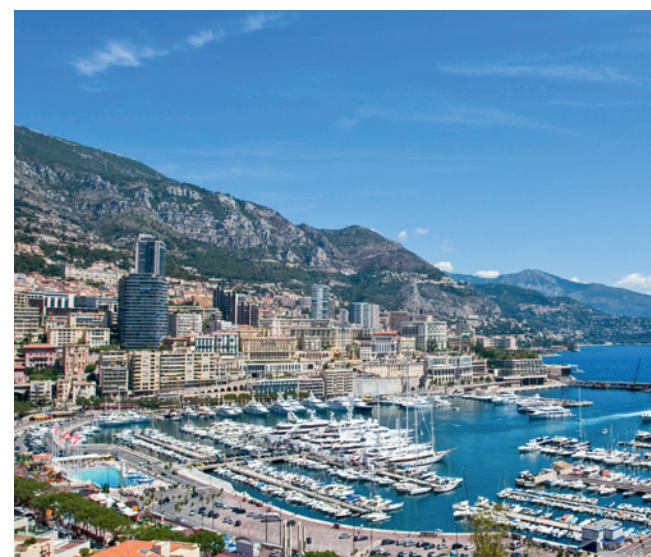
Il porto Hercules di Monaco