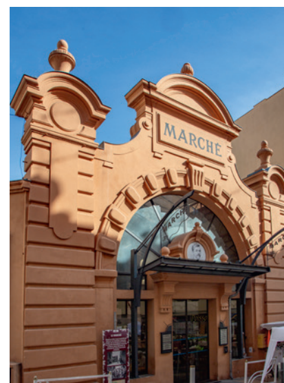
Il mercato coperto di Beausoleil