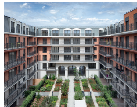
Quartier des arts - PUTEAUX | 92