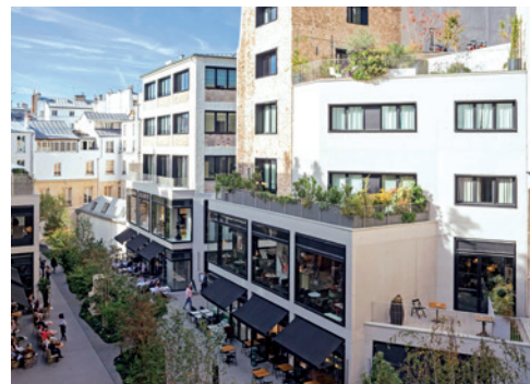
Beaupassage - PARIS | 7