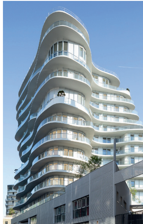
Unic - PARIS | 17

Emerige, società per azioni semplificata, con capitale sociale di 3457200 €, iscritta nel Registro delle Imprese di Parigi con il numero 350439543 - Sede sociale: 121 avenue de Malakoff 75116 Parigi. Architetto: Atelier Allione - Rendering: La Fabrique à Perspectives - Immagini con valore puramente illustrativo. Documento e informazioni non vincolanti - Realizzazione : © commeuneloge.net - 03/2024