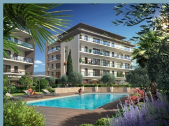
L'OLIVERAIE DE ST-JEAN - ANTIBES