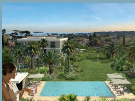
PARADISE CAP - CAP D'ANTIBES