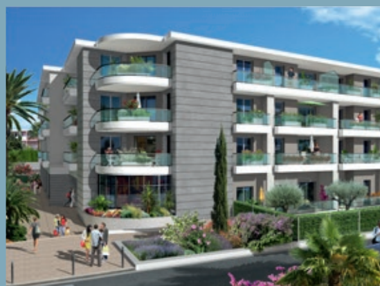
VILLA THALIA - ANTIBES