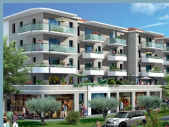
CLOS CINÉREA - ANTIBES