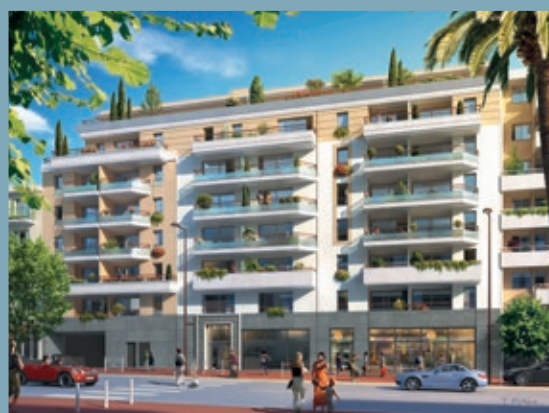
MARINA BAY - ANTIBES JUAN-LES-PINS