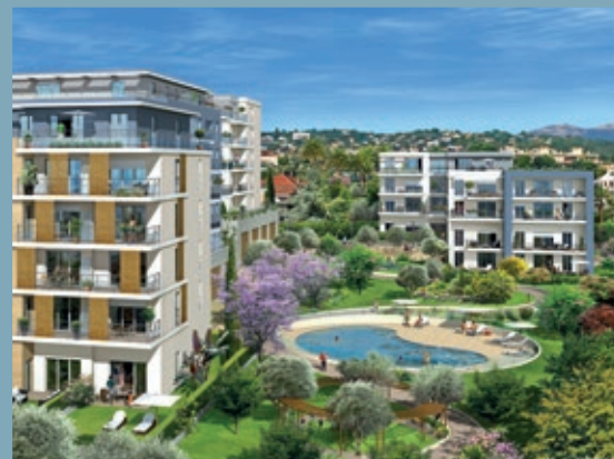
PARC DES AMARRINES - ANTIBES