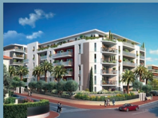
PATIO VERDE - ANTIBES