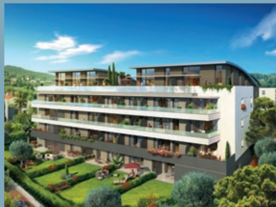
BLUE LINE - ANTIBES