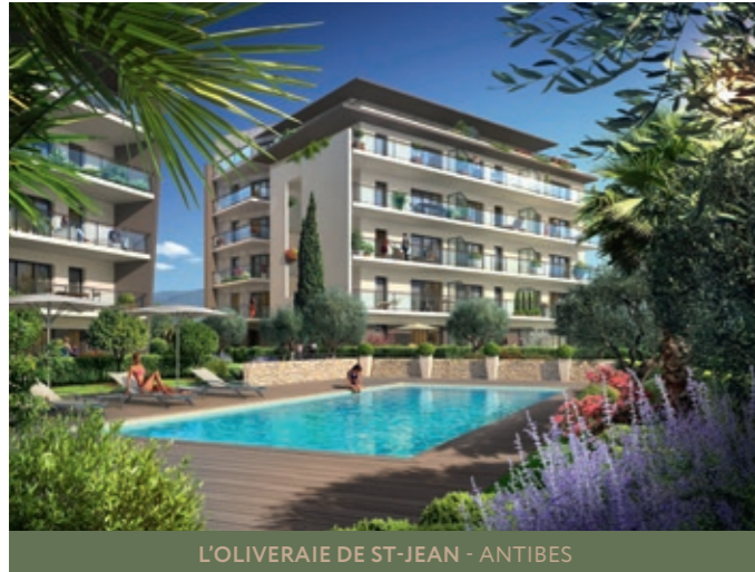
L'OLIVERAIE DE ST-JEAN - ANTIBES