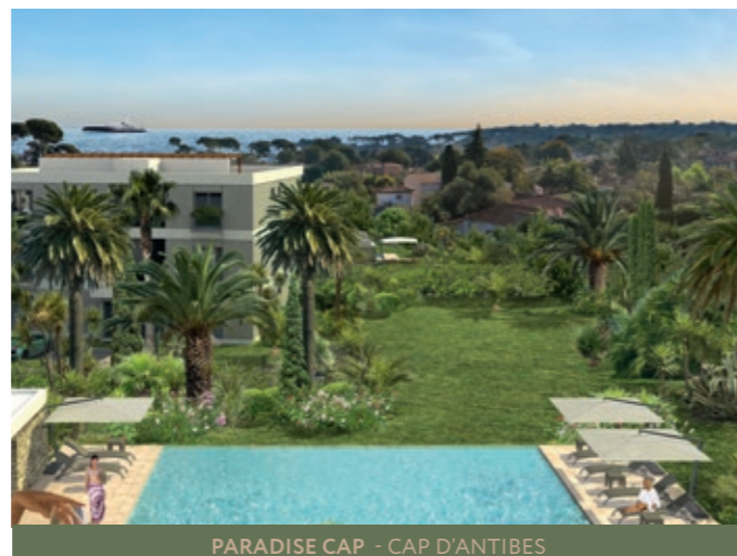
PARADISE CAP - CAP D'ANTIBES