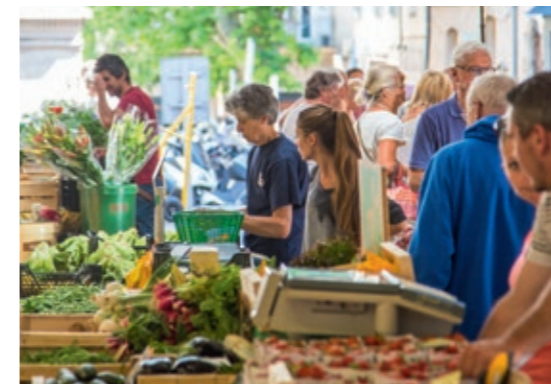
Le marché provençal au cœur du vieil Antibes