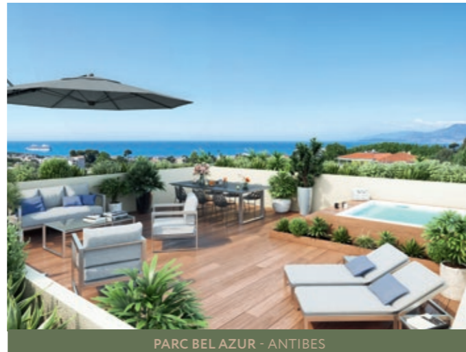
PARC BEL AZUR - ANTIBES