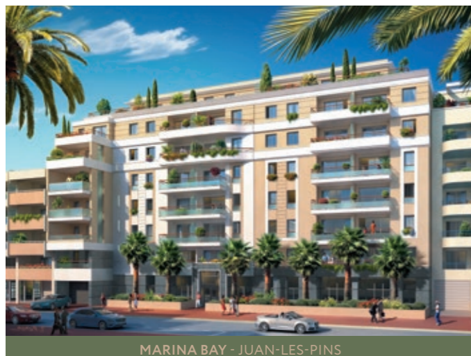
MARINA BAY - JUAN-LES-PINS