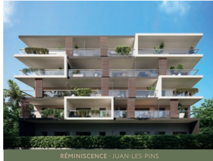
RÉMINISCENCE - JUAN-LES-PINS