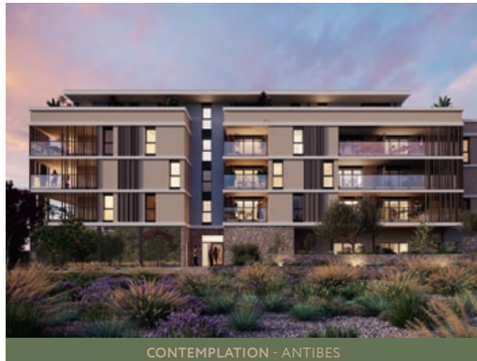
CONTEMPLATION - ANTIBES