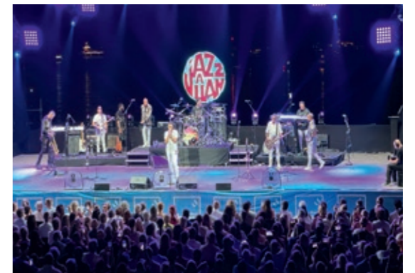
Festival international Jazz à Juan