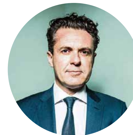
Christophe Béchu, Ministre de la Transition écologique et de la Cohésion des territoires de France, Maire d'Angers et Président d'Angers Loire Métropole

« La ville comme nous la pensons et nous l'imaginons doit être une ville qui pense à demain. Dans cette période de réflexion sur la transition écologique sur notre territoire, nous souhaitons par l'aménagement du secteur des Bretonnières, concrétiser nos ambitions. La ville verte et durable ne doit plus être une idée, mais une réalité. Avec les Bretonnières nous passerons le cap des mots pour arriver à celui des réalisations. »